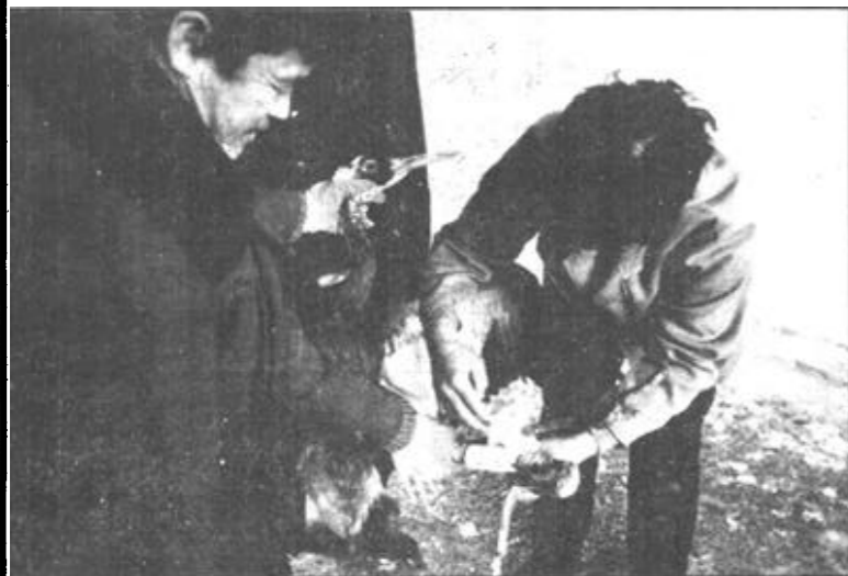
▲管理人员对腿部受伤的白枕鹤进行包扎。